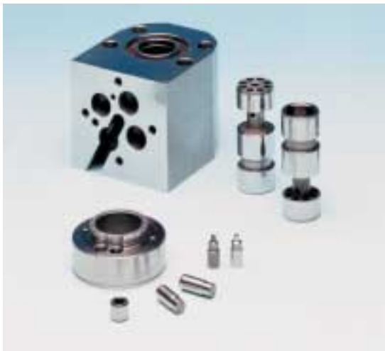
Produkte des Bereichs Präzisions- mechanik