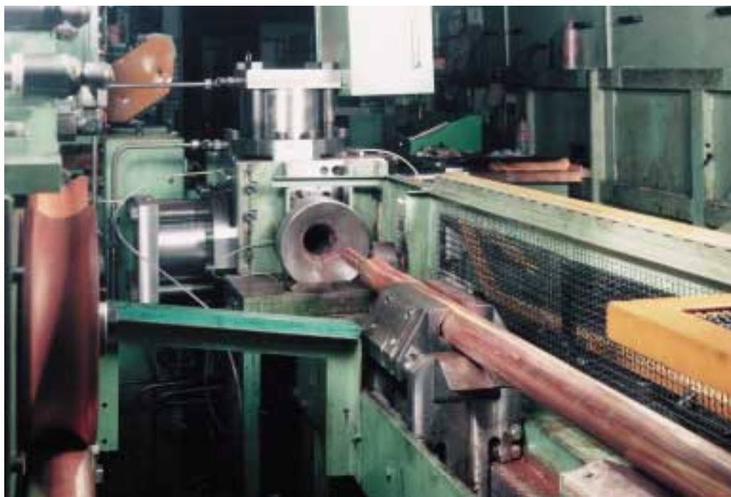
Teil einer Kupfer- rohrziehanlage