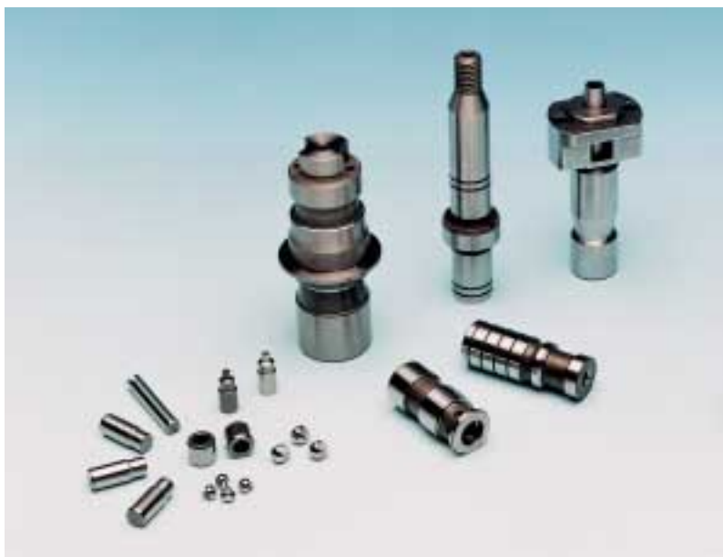
Produkte des Bereichs Präzisions- mechanik

Die Zahlungsströme des Konzerns sind in der Kapitalflussrechnung in die Bereiche laufende Geschäftstätigkeit und Investitionstätigkeit aufgeteilt. Auswirkungen von Veränderungen des Konsolidierungskreises sind in den jeweiligen Positionen eliminiert.