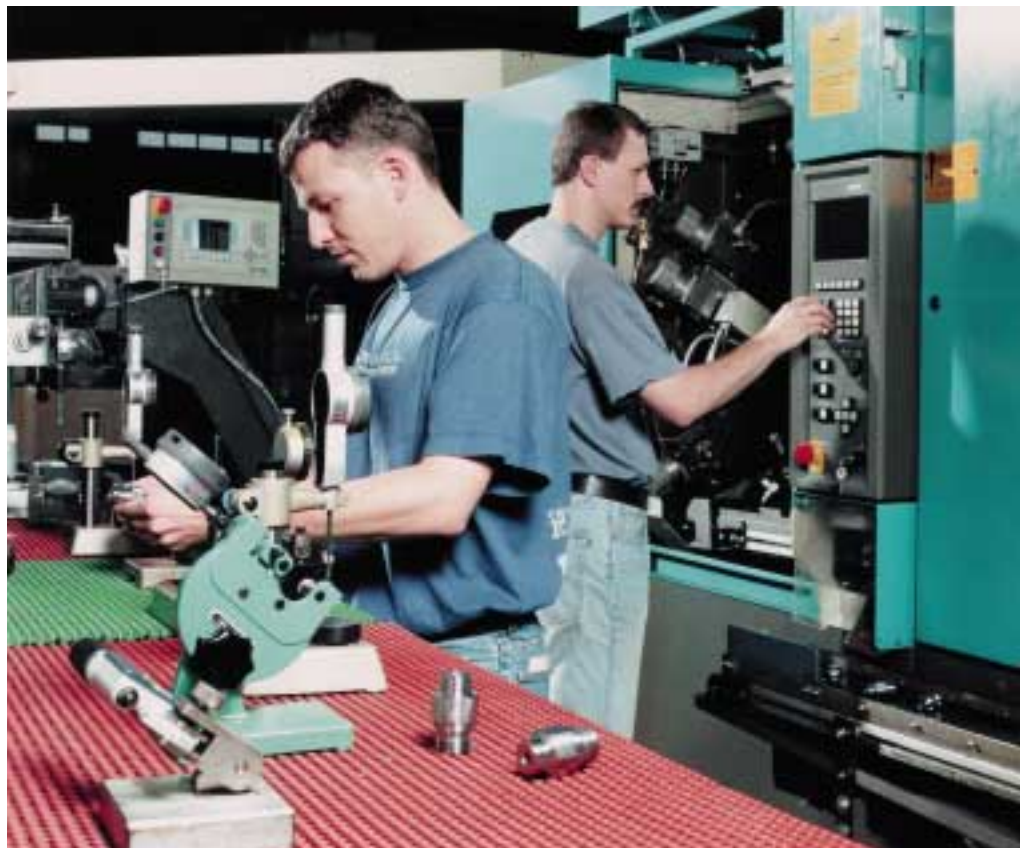
Mehrspindeldreh- automat in der Präzisionsmechanik

Die zunehmende Globalisierung in der Automobilindustrie und bei deren Zulieferanten sowie die Tatsache, dass Wettbewerber in vielen Ländern sich zunehmend ertüchtigen, auch komplexere Kundenwünsche zu erfüllen, führen neben dem Rückgang der gesamten Automobilproduktion dazu, dass der Wettbewerb um die Aufträge härter wird. Branchenweit, und dies betrifft nicht nur unsere Mitwettbewerber in Europa sondern auch die in den USA, ist ein deutlicher Verfall der Margensituation festzustellen. Neue Systeme in den Einkaufsabteilungen unserer Kunden, wie zum Beispiel Internetauktionen und Beschaffungsportale, verdrängen zudem das technische Gespräch und stellen reine Rabattverhandlungen in den Vordergrund. Durch die Hereinnahme von Neuaufträgen konnte im vergangenen Geschäftsjahr die Auslastung der Kapazitäten für die kommenden Jahre gesichert werden.