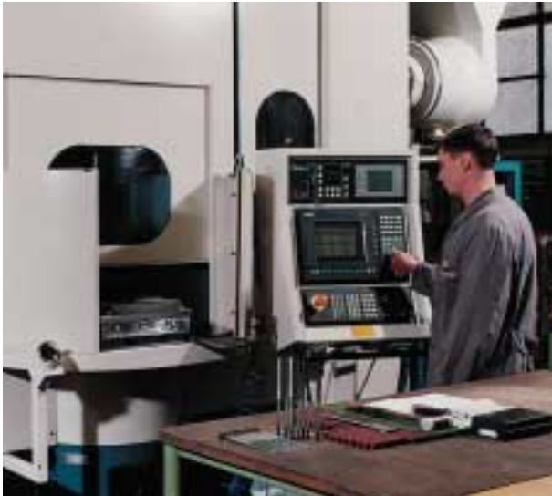
Flachschleifen mit Rundteller